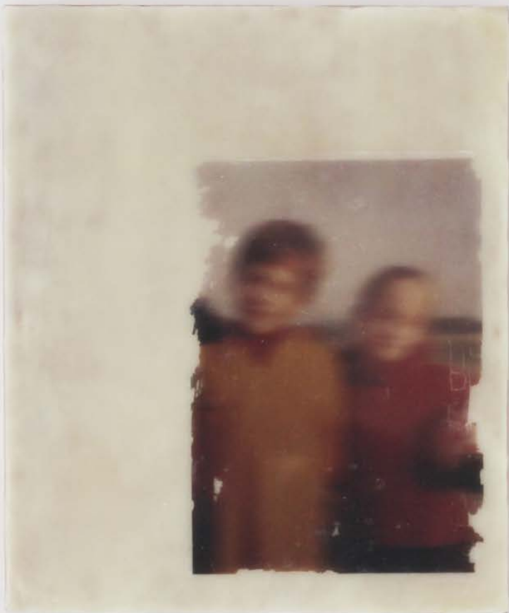
The garden of my memories, 2025 photo transfer, cire d'abeille. 30 x 25 x 3 cm