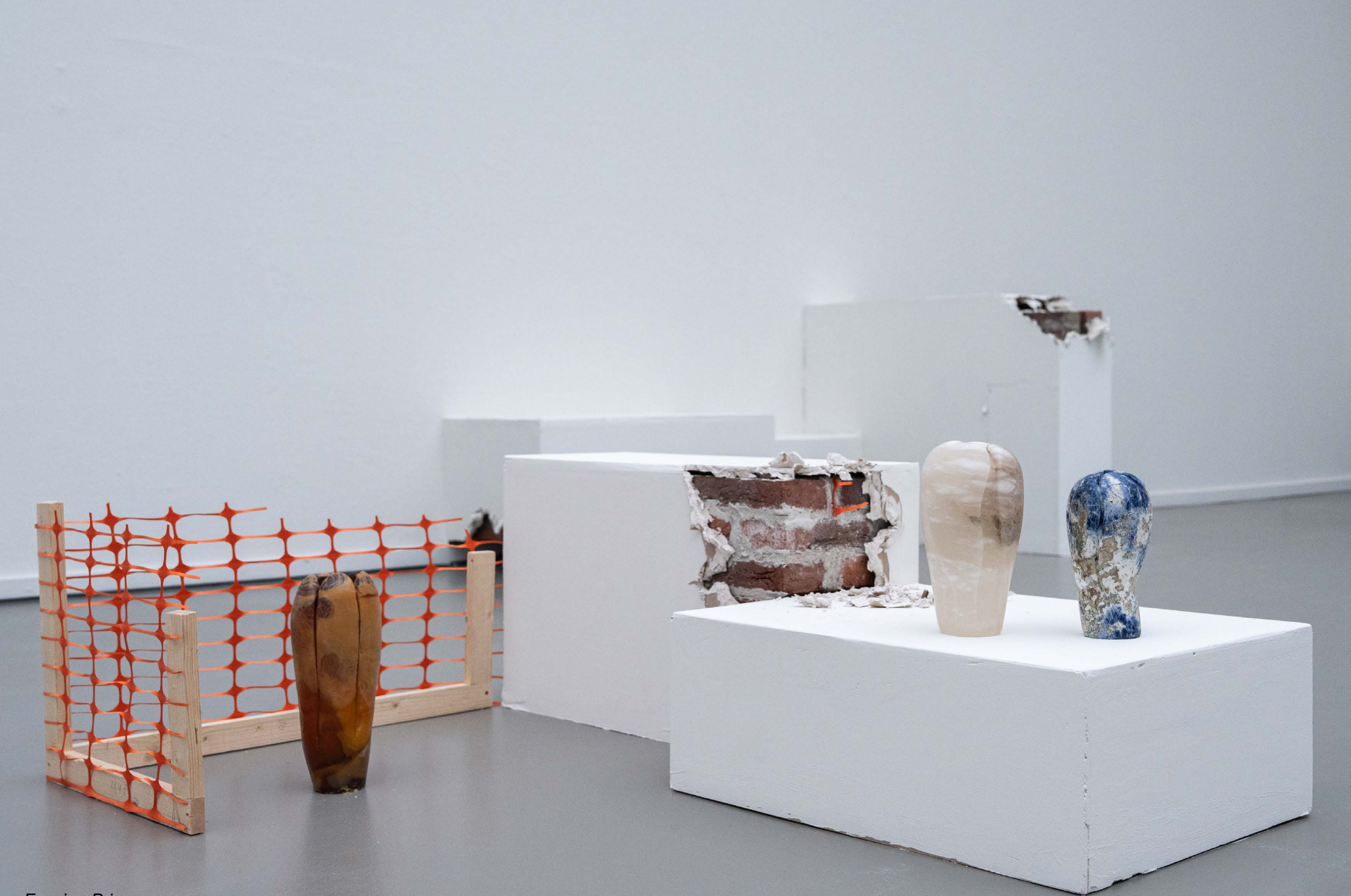
Evening Primerose, 2025 Marbre, Soldalite bleue, cire, resin d'arbre