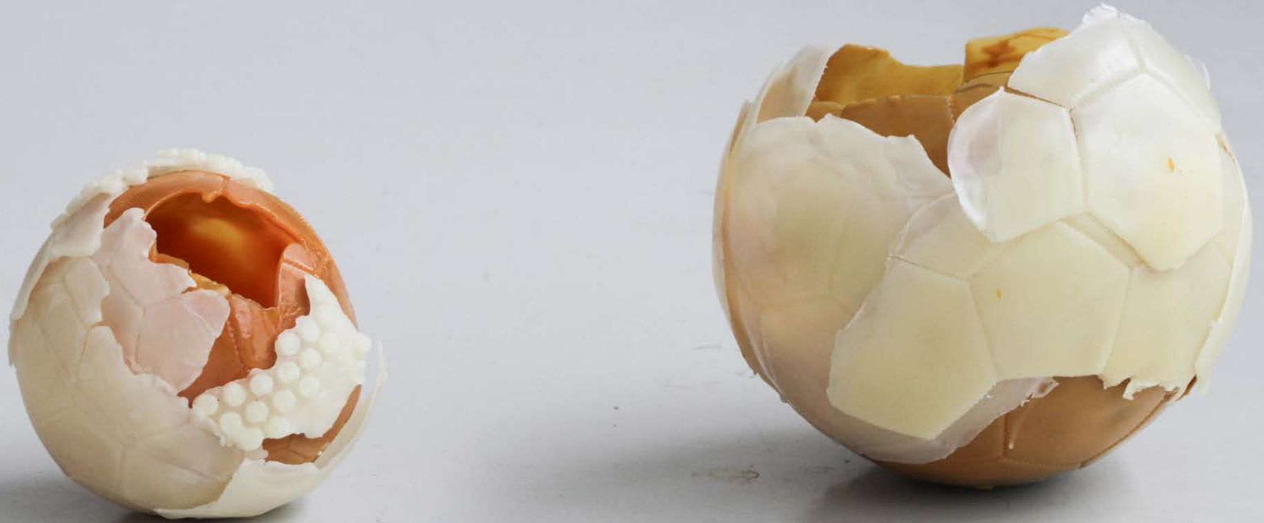
The garden of my memories, 2025 Cire d'abeille, resin d'arbre, senteur. 25 x 25 x 25 cm