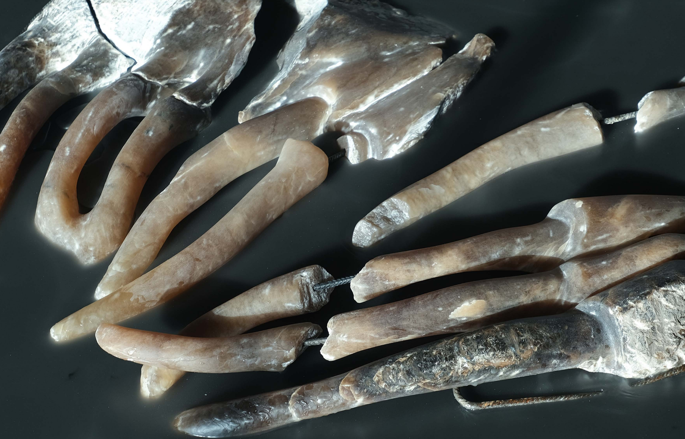
Fragment of domestic pigs, 2021