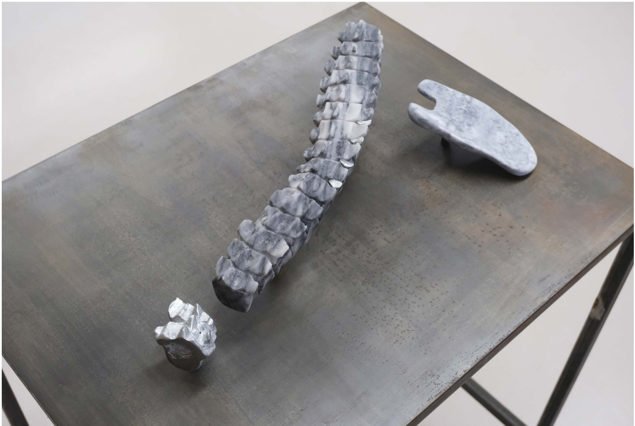
Dual spine , 2023 Marbre, metal, 45 × 10 × 12 cm