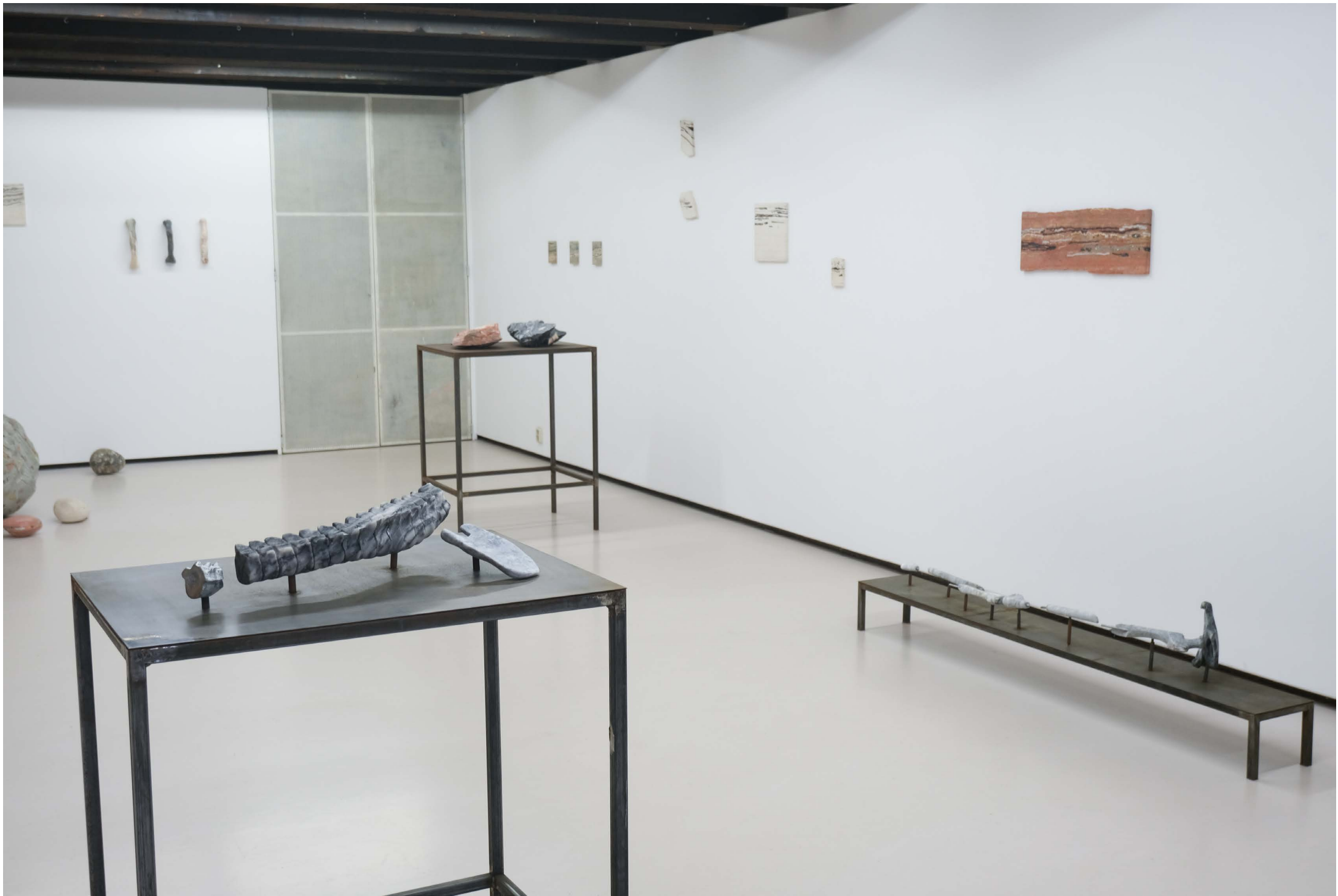
Reading your notes in the strata, 2023 Installation view; Metal, marbre