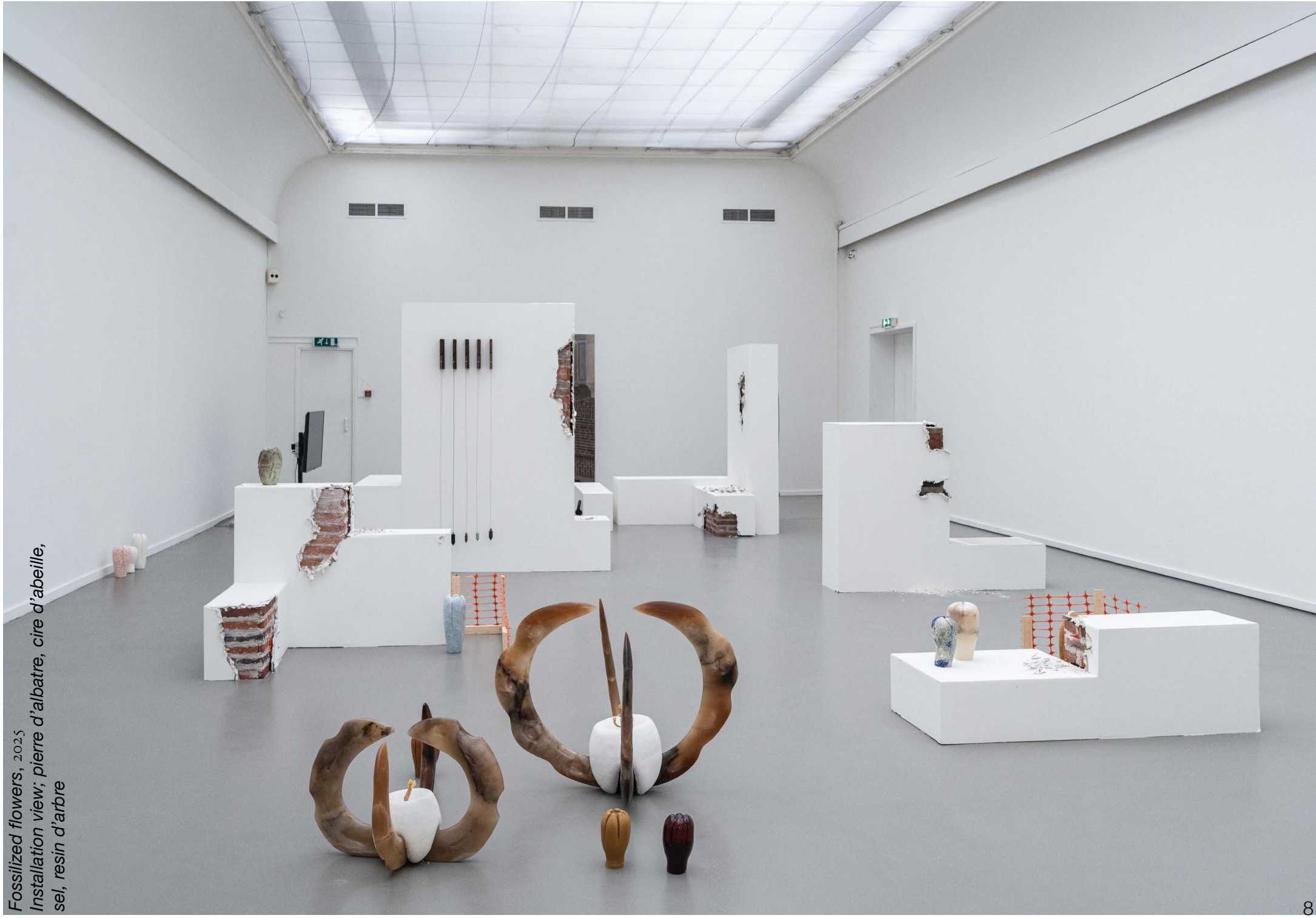
Fossilized flowers, 2025 Installation view; pierre d'albatre, cire d'abeille, sel, resin d'arbre