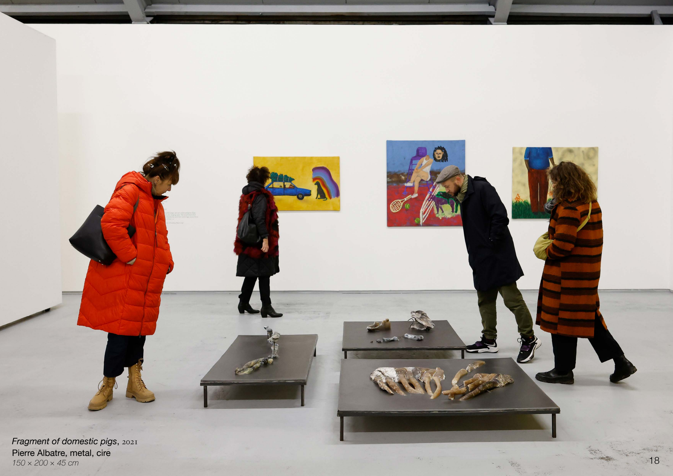
Fragment of domestic pigs , 2021 Pierre Albatre, metal, cire 150 x 200 x 45 cm