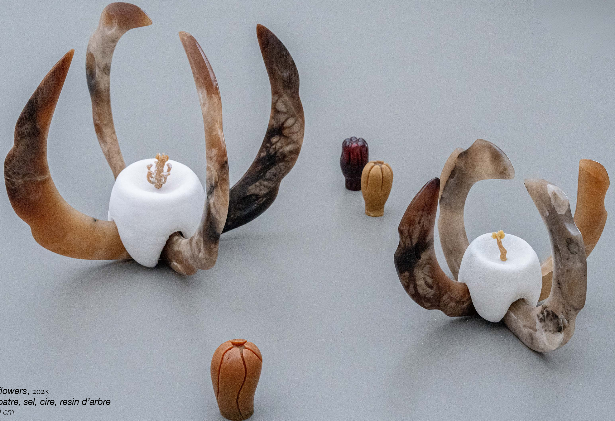
Fossilized flowers, 2025 Pierre d'Albatre, sel, cire, resin d'arbre 60 x 60 x 60 cm 30x 30x 30 cm