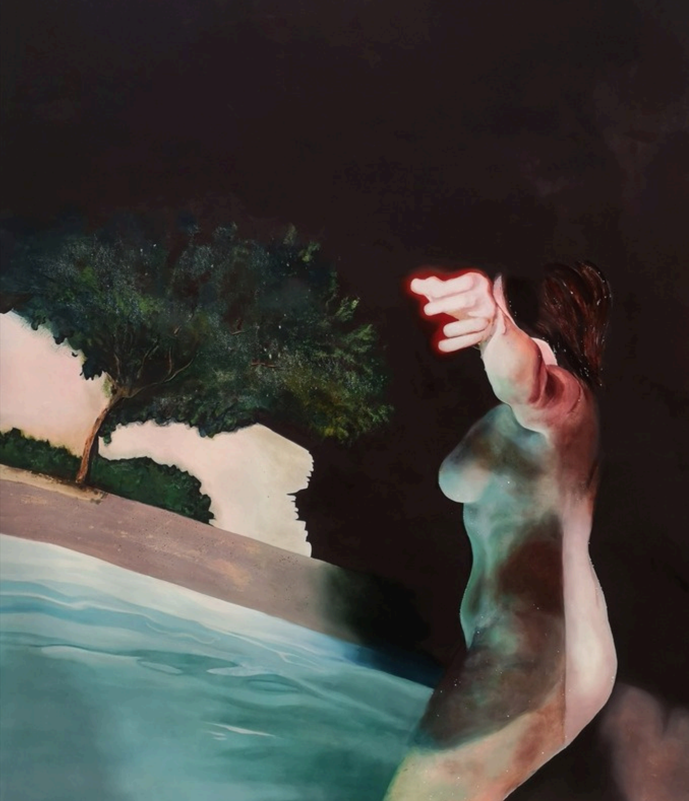
Autoportrait Huile sur papier, préparation à l'oeuf 180 x 160 cm 2020