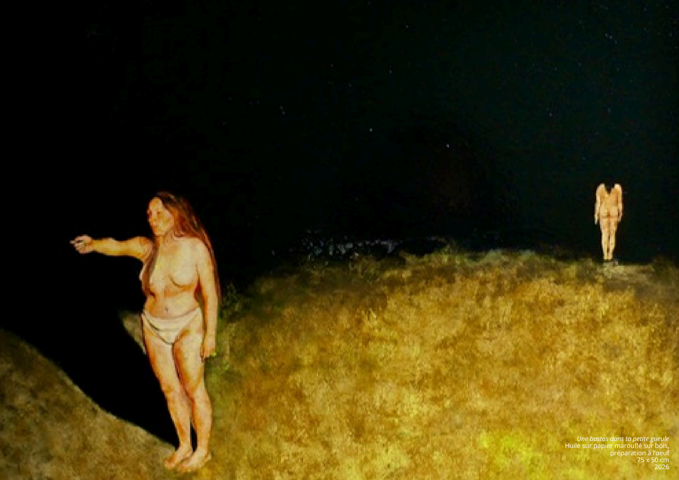
Une bastos dans ta petite gueule Huile sur papier marouflé sur bois, préparation à l'oeuf 75 x 50 cm 2026