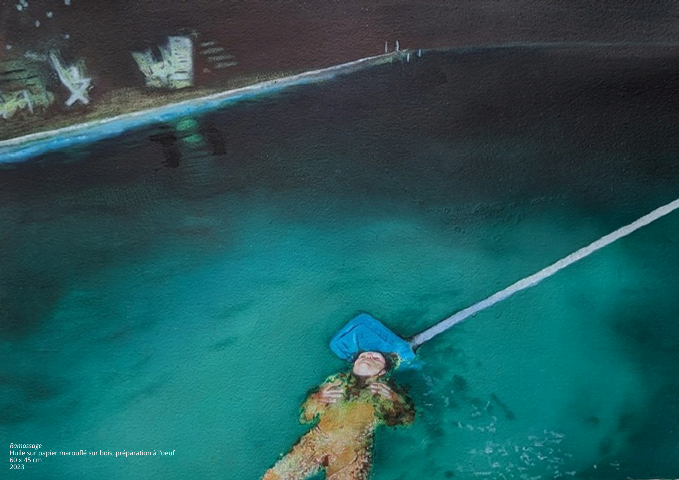
Ramassage Huile sur papier marouflé sur bois, préparation à l'oeuf 60 x 45 cm 2023