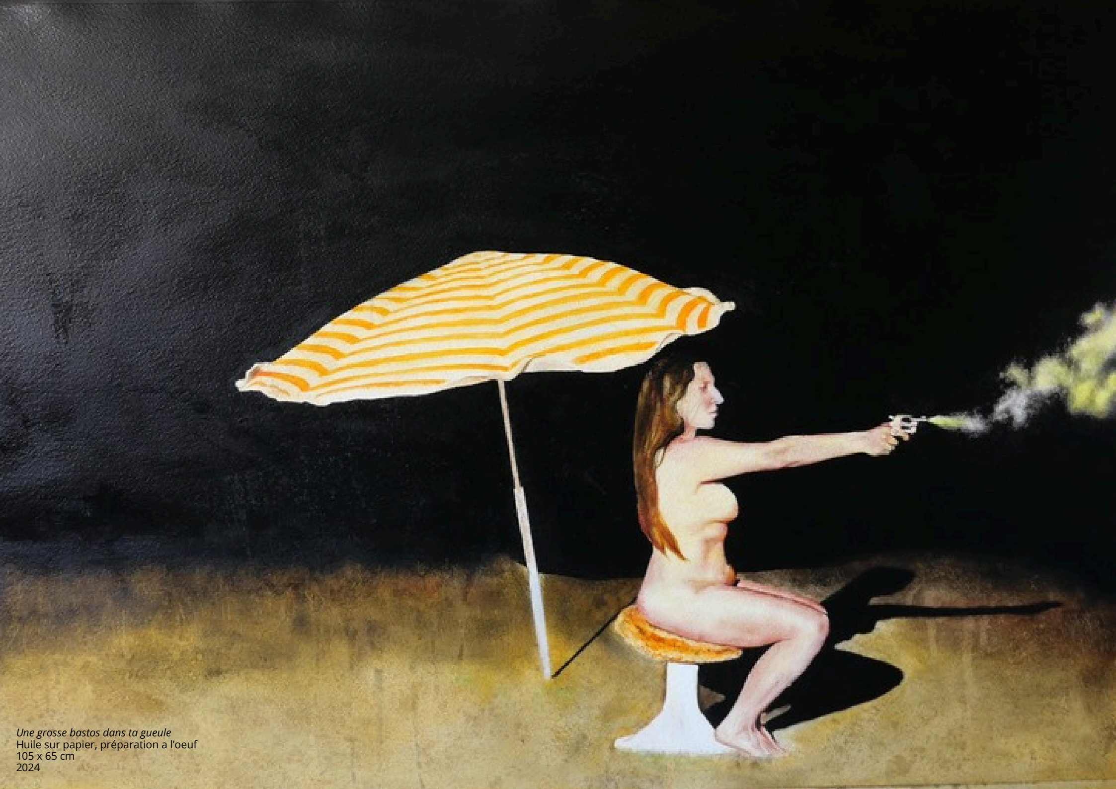
Une grosse bastos dans ta gueule Huile sur papier, préparation à l'oeuf 105 x 65 cm 2024