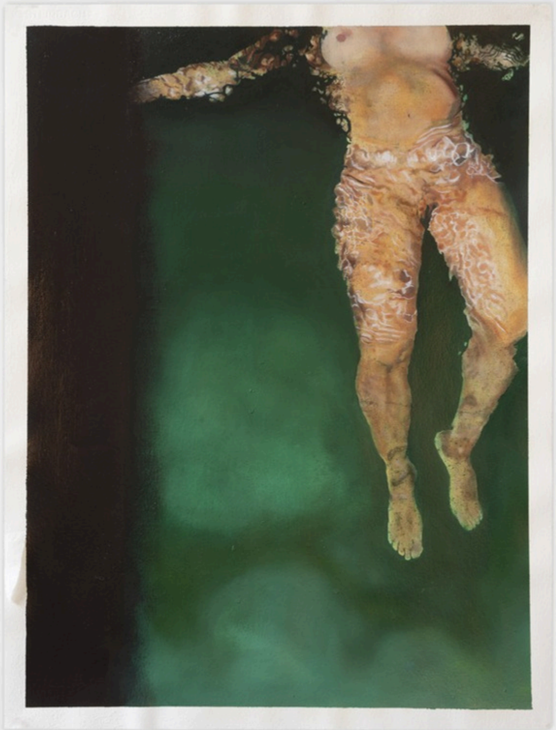
Jesus Christe Huile sur papier, préparation à l'oeuf 70 x 50 cm 2022