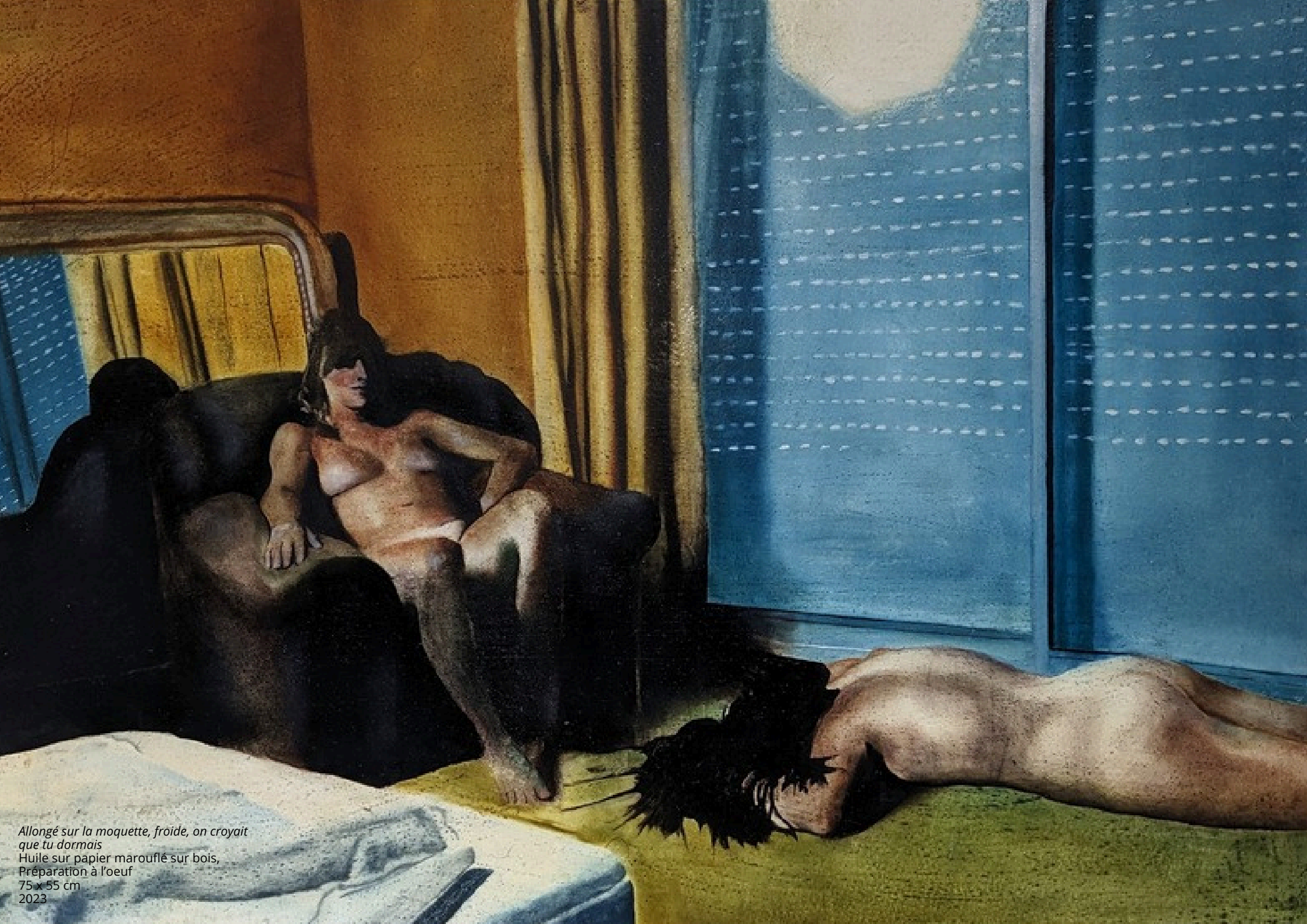
Allongé sur la moquette, froide, on croyait que tu dormais Huile sur papier marouflé sur bois, Préparation à l'oeuf 75 x 55 cm 2023