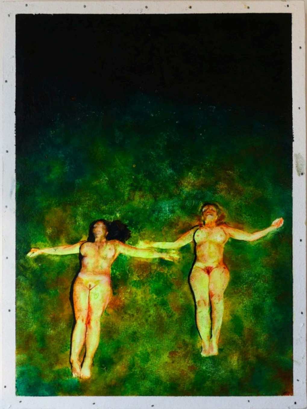
Deux petites Christes Huile sur papier marouflé 28 x 38 cm 2023