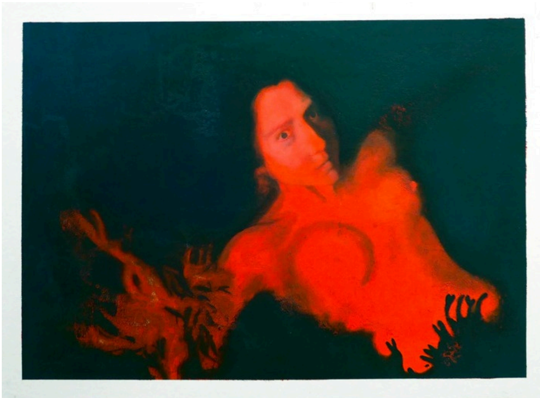
L'algue Huile sur papier marouflé sur bois, préparation à l'oeuf 100 x 75 cm 2024