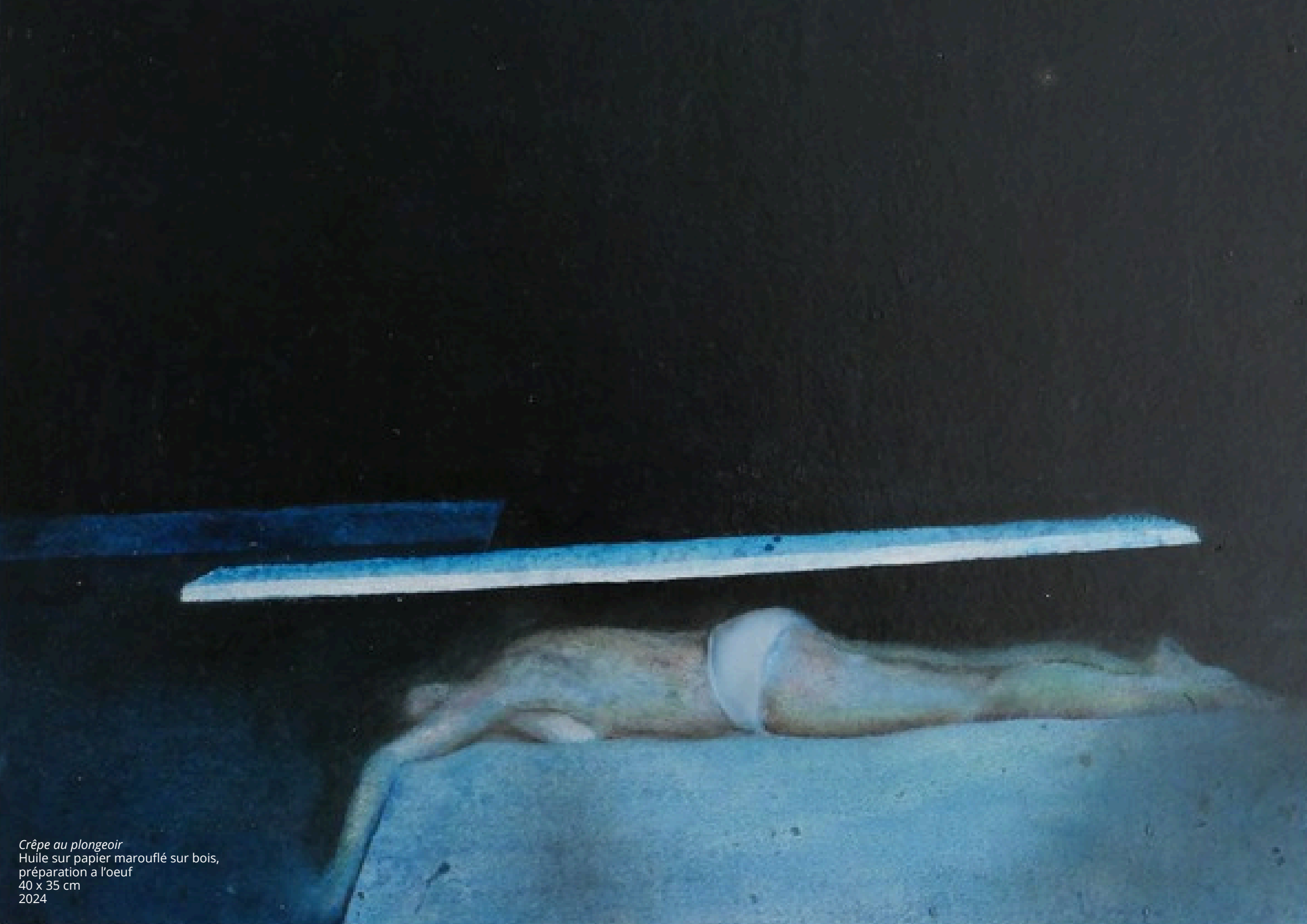
Crêpe au plongeur Huile sur papier marouflé sur bois, préparation à l'oeuf 40 x 35 cm 2024