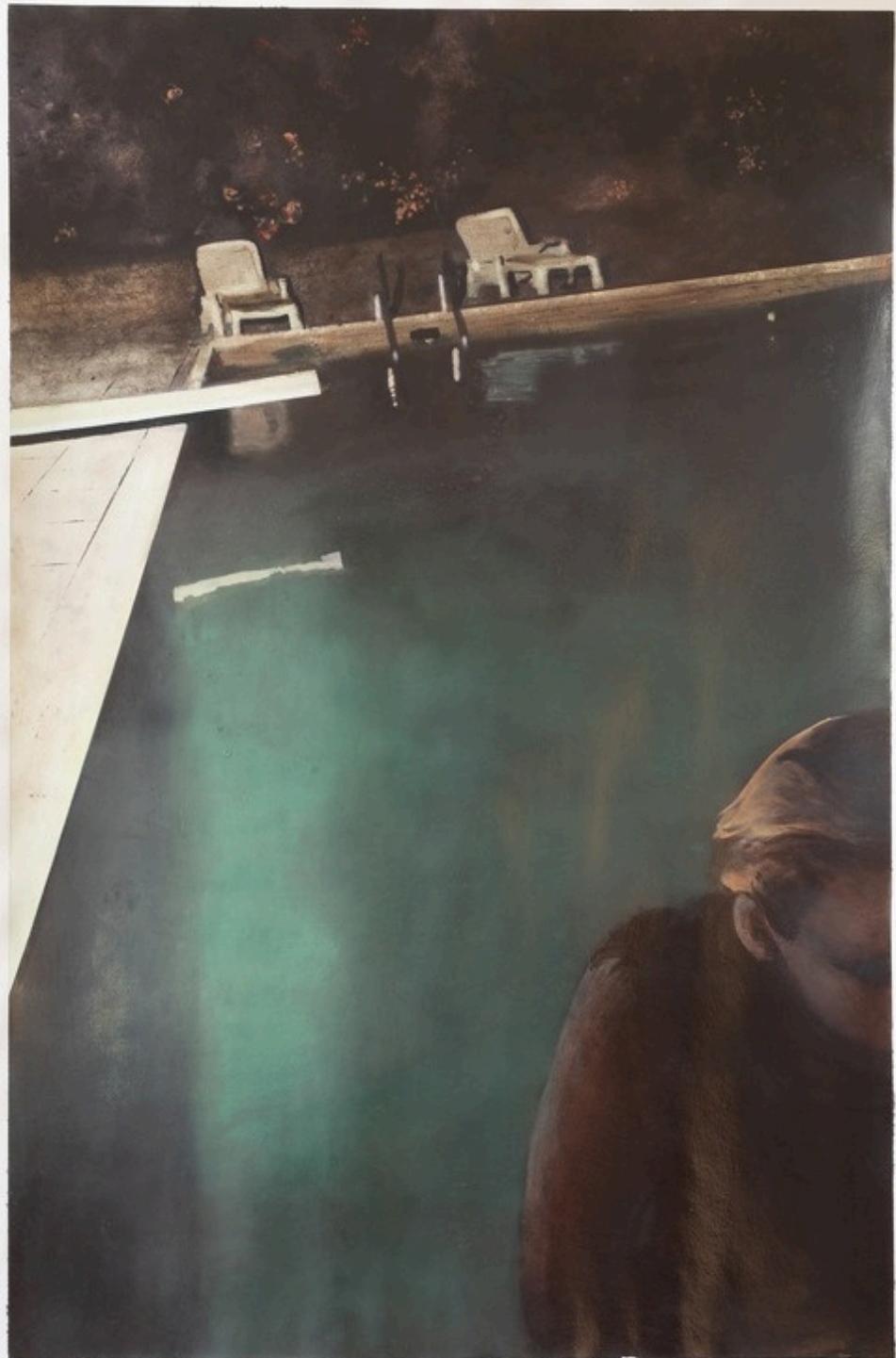
Les transats Huiles sur papier 110 x 70 cm 2022