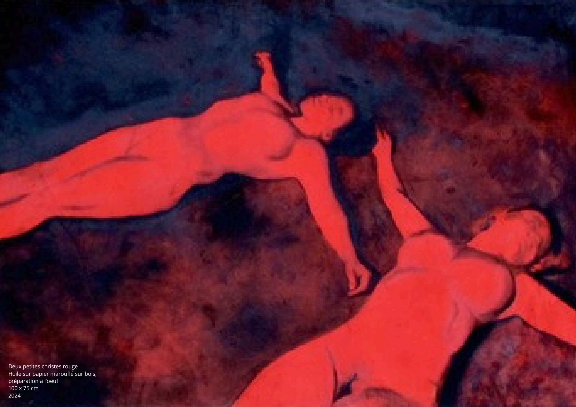
Deux petites christes rouge Huile sur papier marouflé sur bois, préparation à l'oeuf 100 x 75 cm 2024