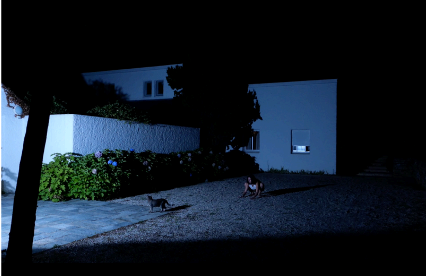
La nuit nocturne des chats Vidéo 2025