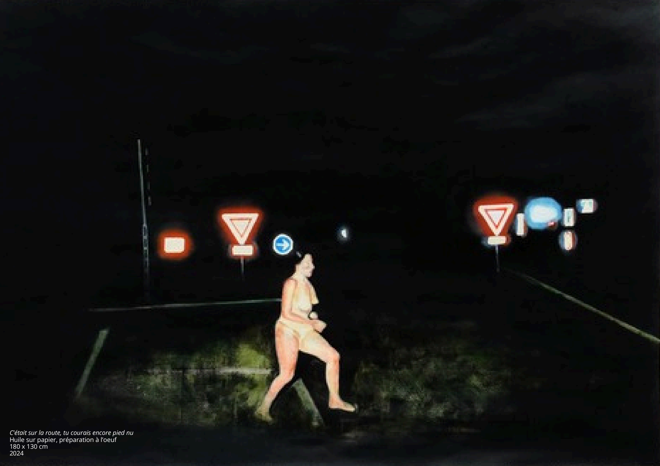
C'était sur la route, tu courais encore pied nu Huile sur papier, préparation à l'oeuf 180 x 130 cm 2024