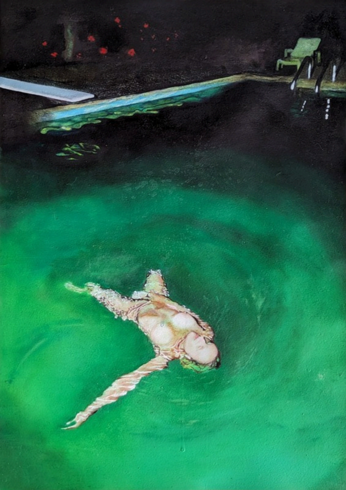
Une huitre en guise de culotte, elle a flotté toute la nuit Huile sur papier, préparation à l'oeuf 75 x 50 cm 2023