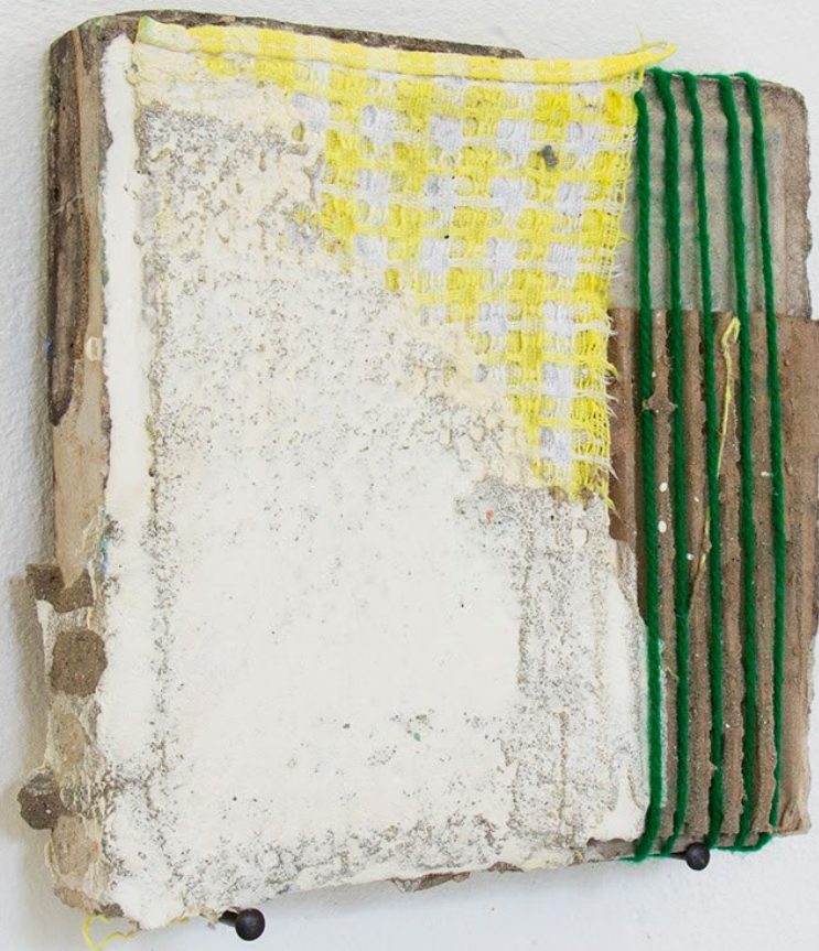
Idiot, 2026, Peinture à la chaux, tissu gaufré, laine et carton sur carrelage récupéré 15 × 15 cm