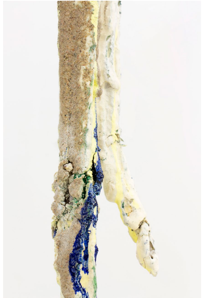
Le lapin et la tempête , 2026 Laine, mortier, colle, peinture à la chaux, pigments peinture à l'huile, colle de peau de lapin, vernis Damar 316×10 cm