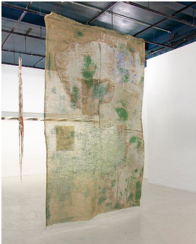
Vue d'exposition Laisser couler , 2026 Fondation Moonens, Bruxelles formats multiples

Sourdre 02 , 2026 Laine, mortier, colle, peinture à la chaux, pigments peinture à l'huile, vernis Damar, cire 338×16 cm