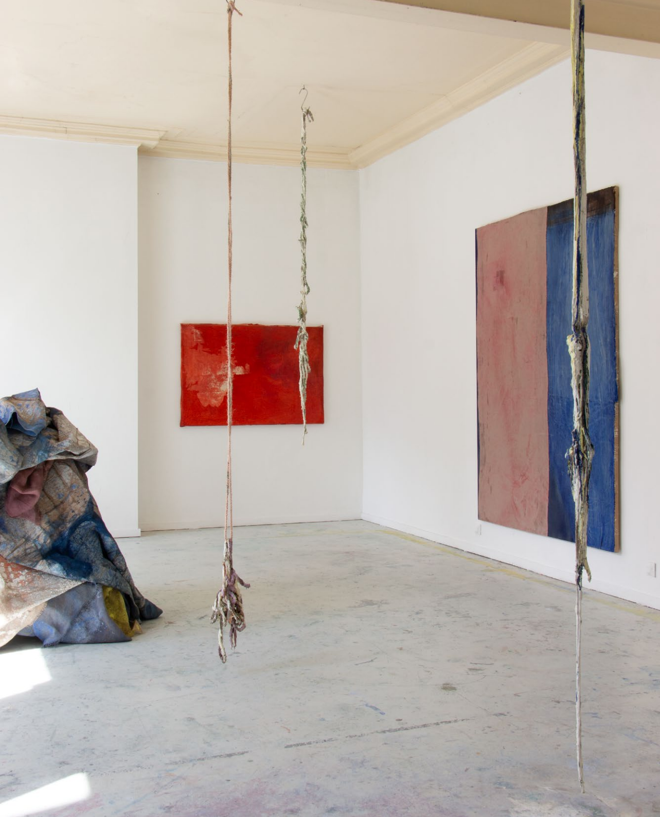
Vue d'exposition de fin de résidence à la Fondation Moonens, 2026