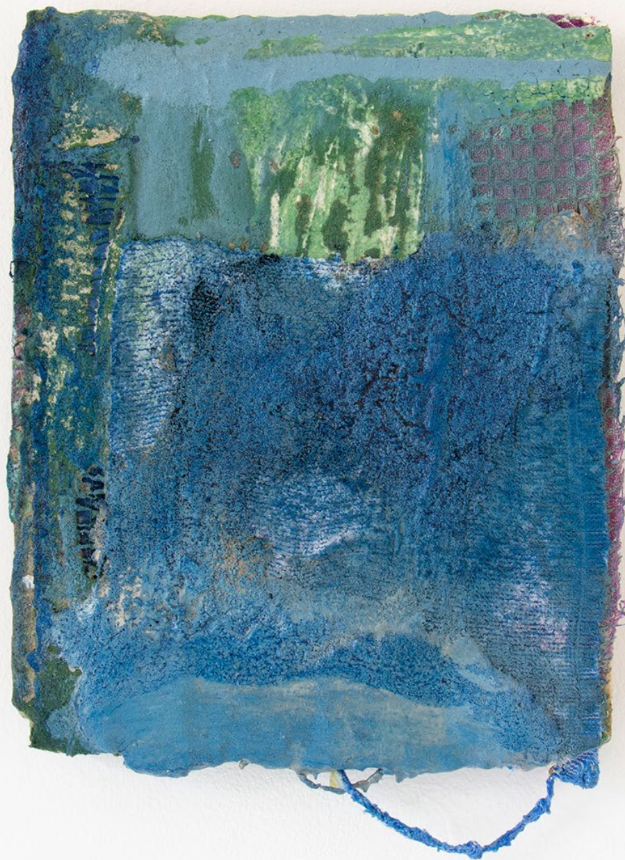
Ne me dis pas de me calmer, 2026 Peinture à l'huile, pigments, mortier, peinture à la chaux, vernis damar sur tissu gaufré, serviette de bain, élastique de caleçon et toile de jute 28×23 cm