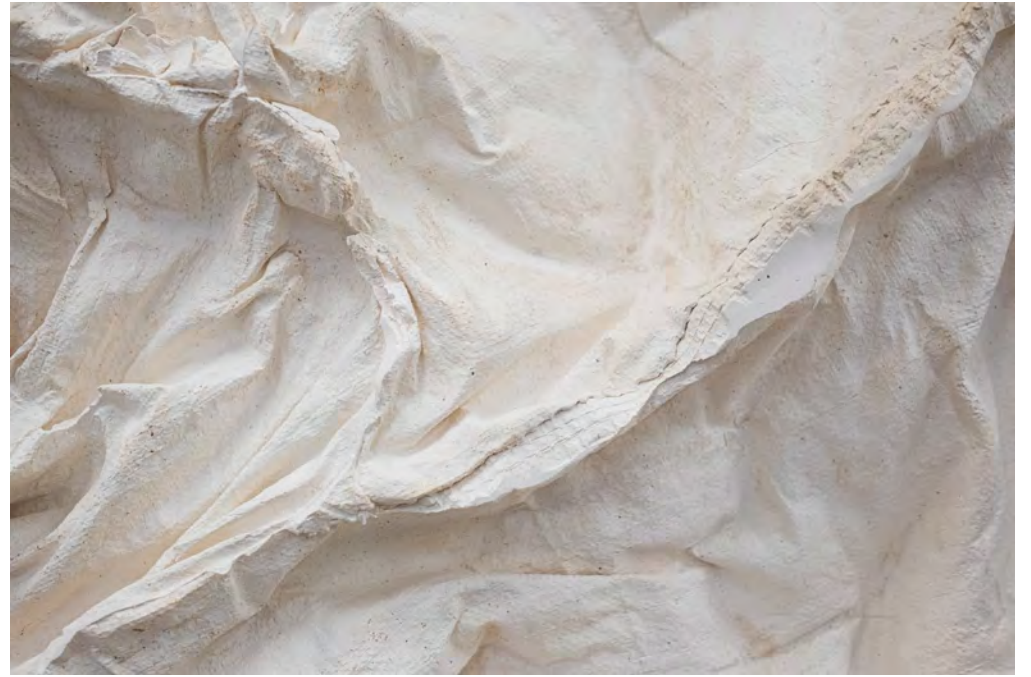
Zone Cramée, 2025 détails