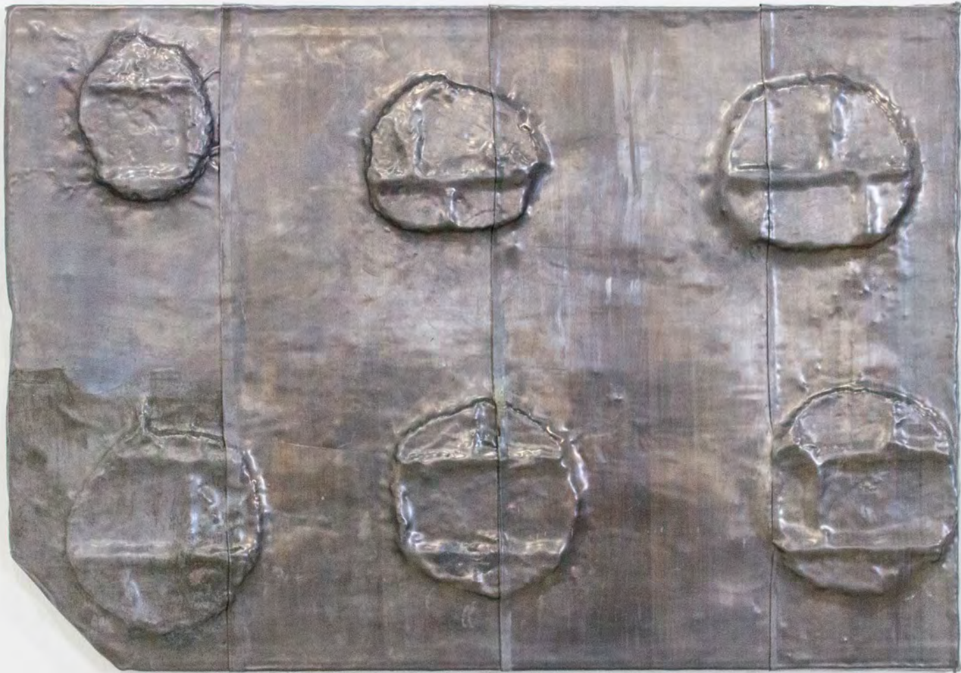
Les Bleus , 2026 Plomb, Placo-plâtre 61x89x5 cm