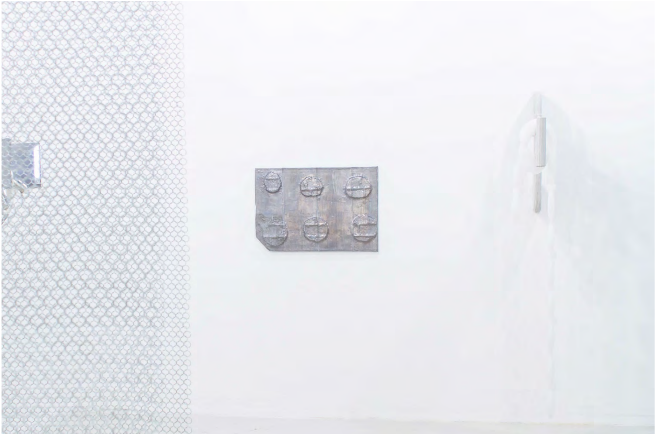
Vue d'exposition, ' Dopamine gilded scaffolds ' group-show 2026, Fondation Moonens, Bruxelles