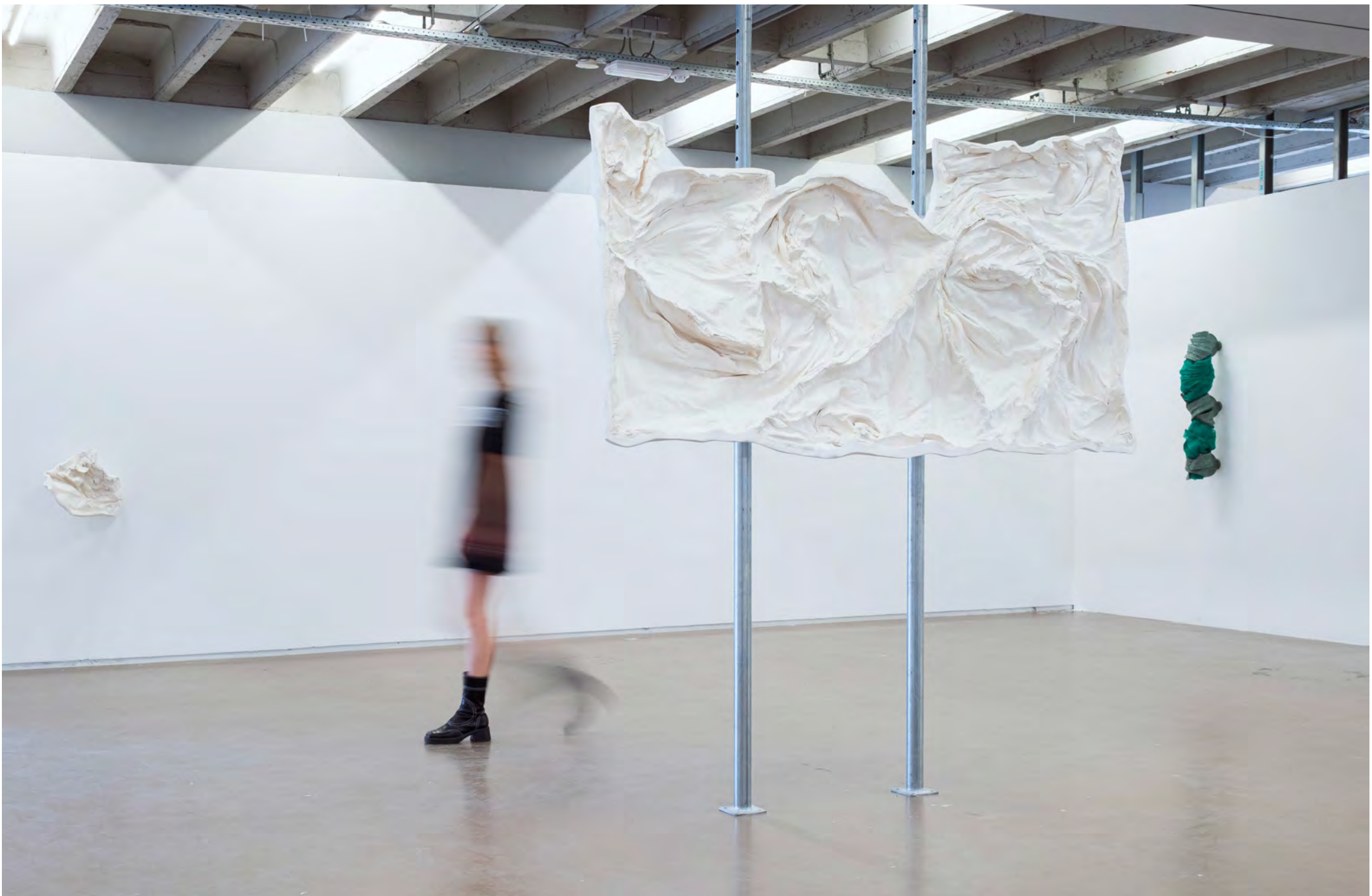
Vue d'exposition, 'Un dernier Goodnight Kiss' , 2025, Espace Vanderboght.