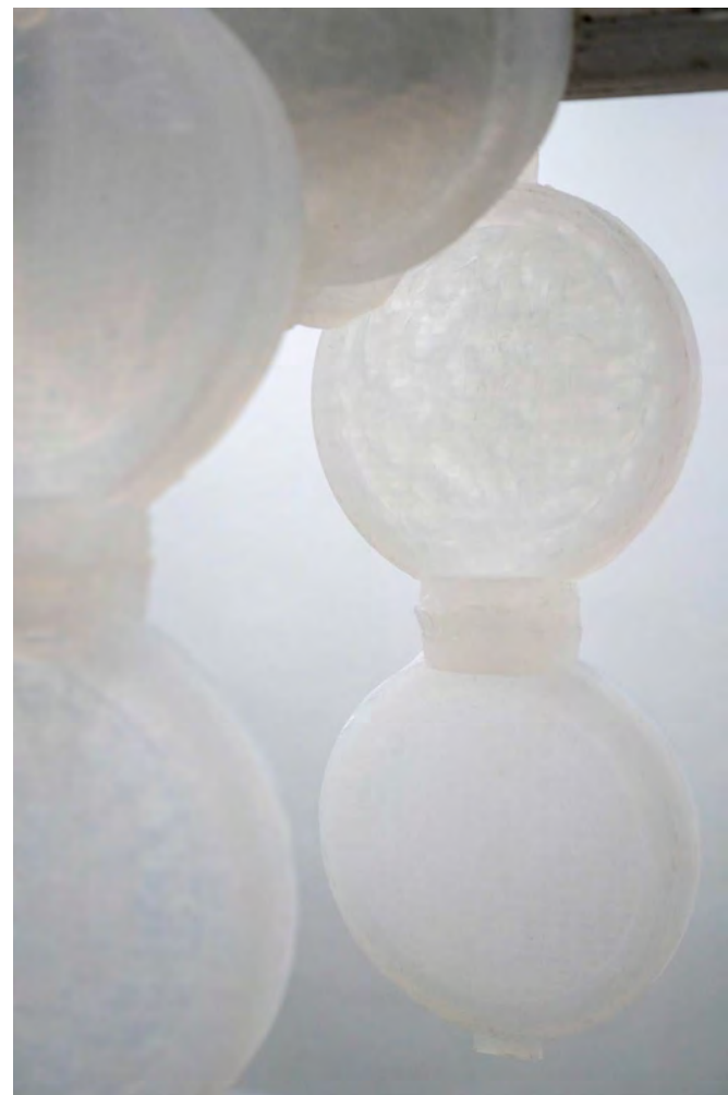
Éclat , 2026 béton, silicone translucide 100x20x250 cm