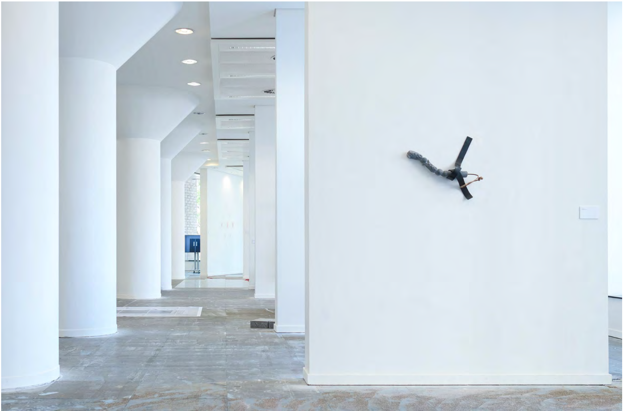
Vue d'exposition, 'Les vents favorables' 2025, Reset Atelier, Bruxelles.