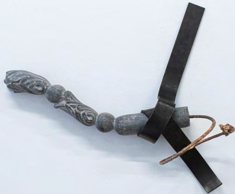
Dynamite, 2025 Pierre bleue, bronze, acier 35x30x7cm