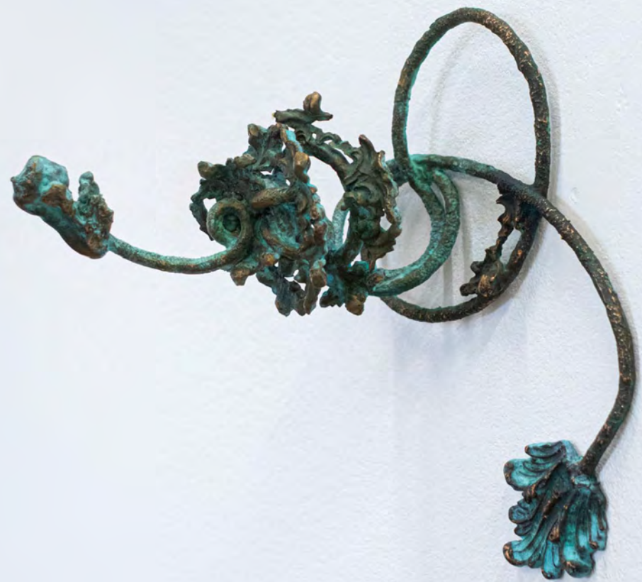
Dernier souffle , 2025 Bronze 18x25x17cm