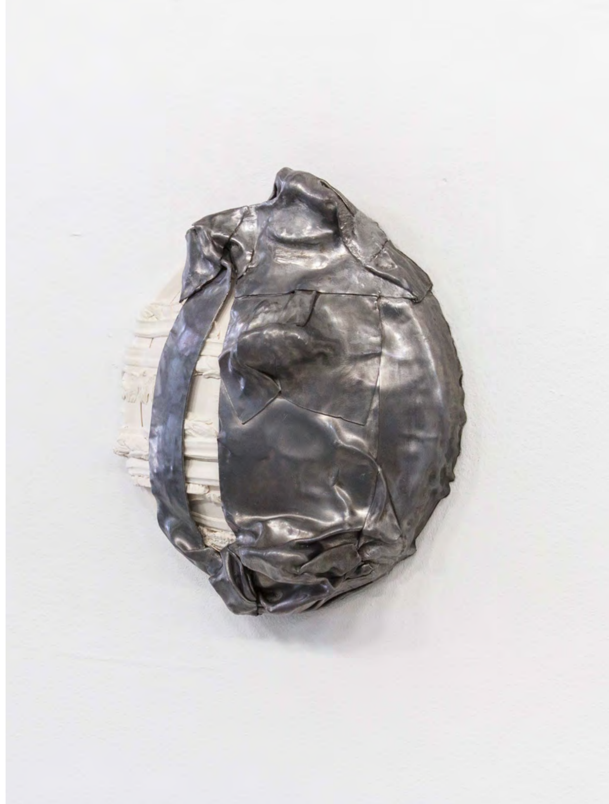
Éteint , 2026 Plomb, plâtre 35x30x13 cm