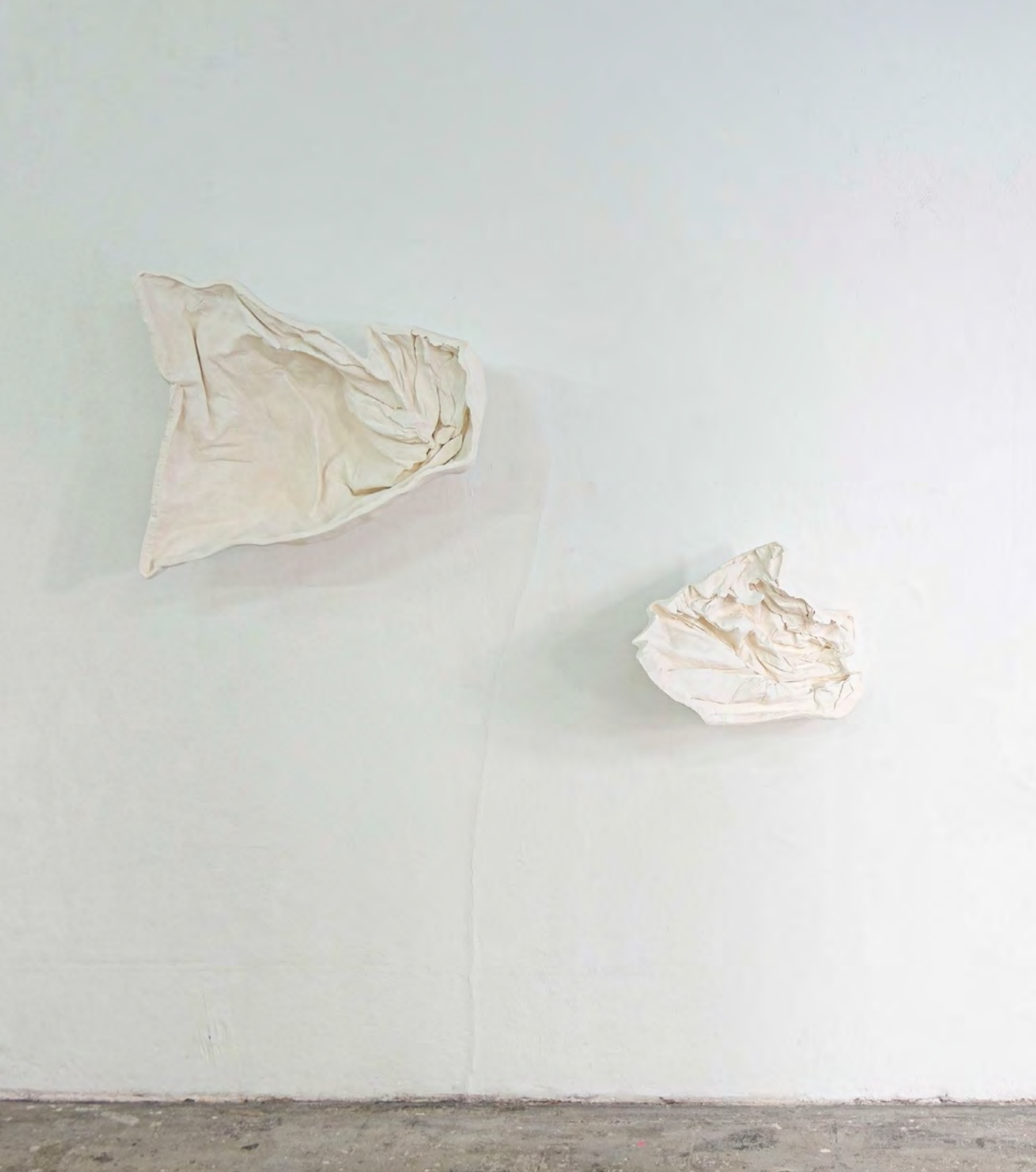
Fragments-Zone Cramée , 2025 Plâtre, acier 60x65x20 & 30x45x20