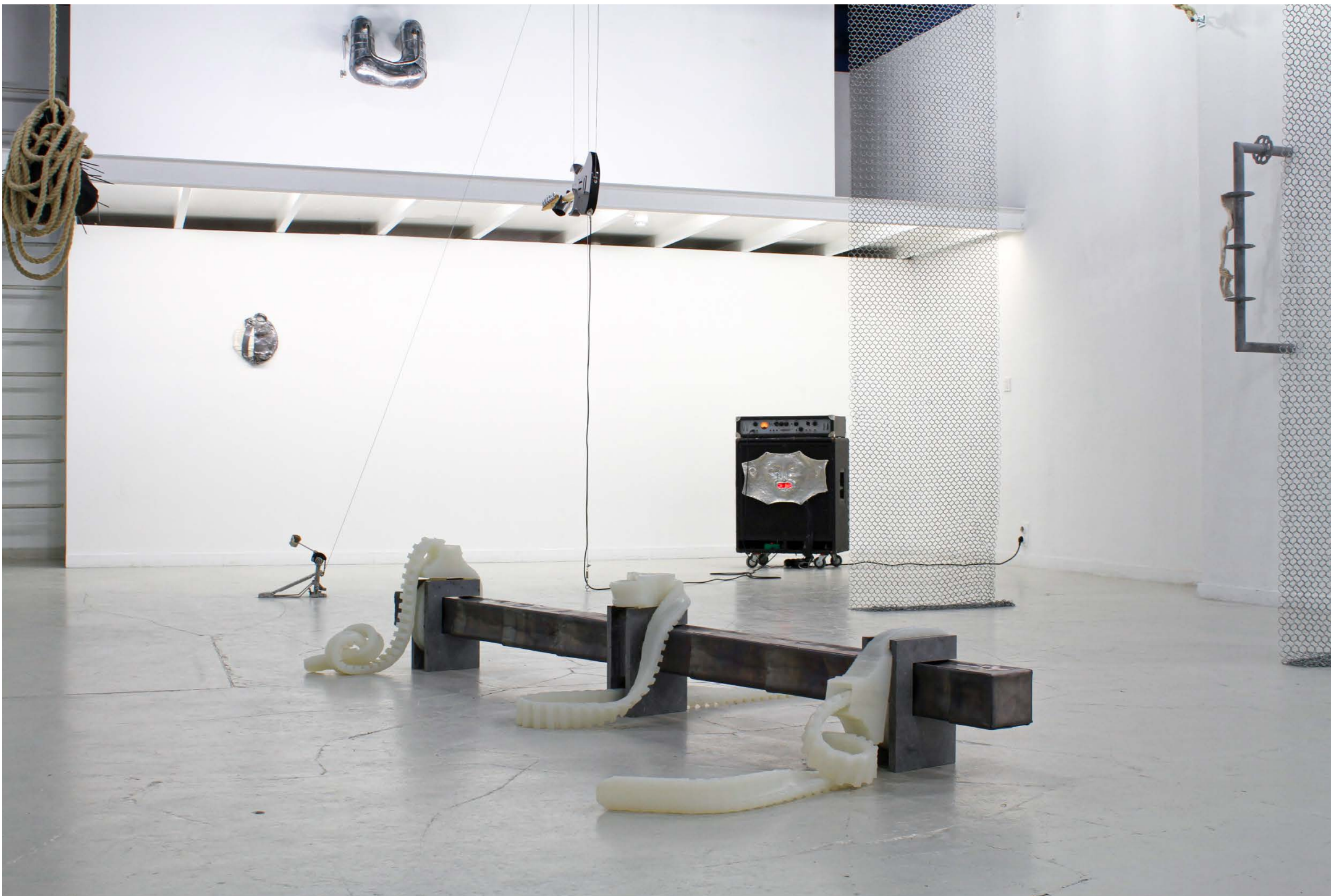
Vue d'exposition, 'Dopamine gilded scaffolds' group-show 2026, Fondation Moonens.