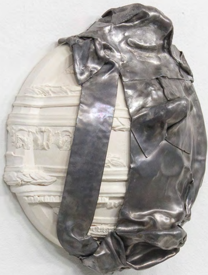
Éteint , 2026 Plomb, plâtre 35x30x13 cm