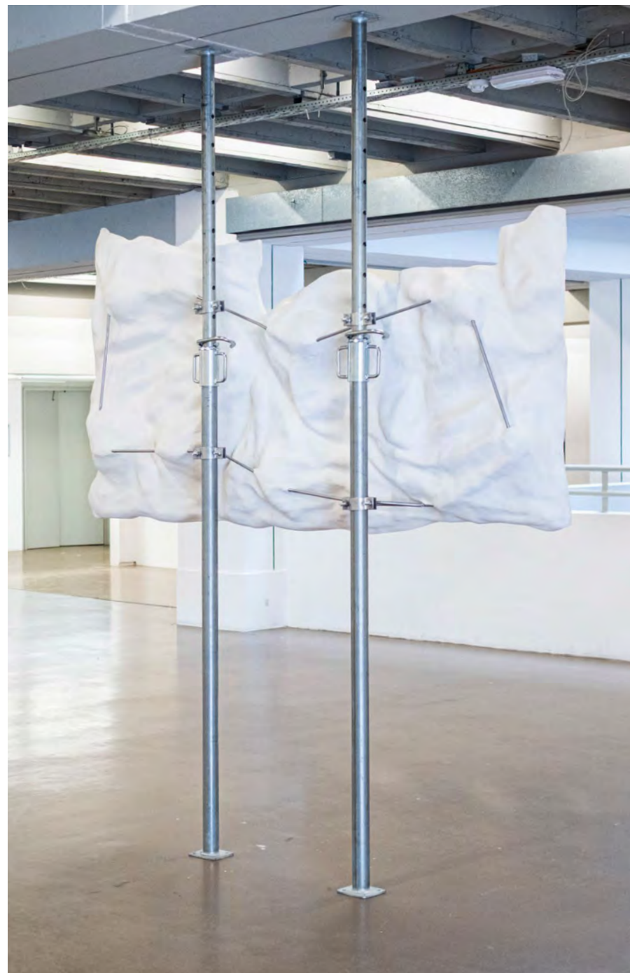
Zone Cramée , 2025 Plâtre, acier, étaçons - 200x115x25cm