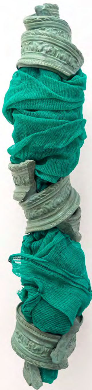
Façade, 2025 Céramique, filet de chantier 100x24x24cm