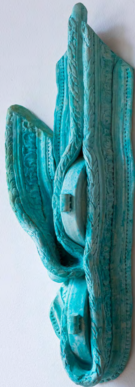
Hors-champ , 2025 Céramique 70x28x18cm