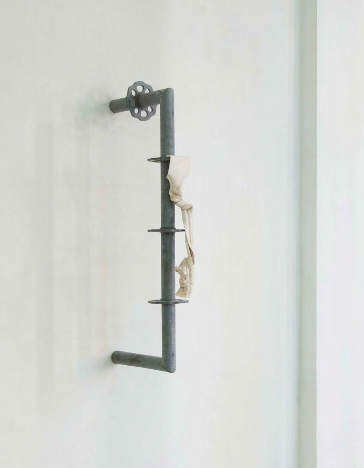
Échafauder, 2026 Pierre bleue, plastique 32x18x40 cm