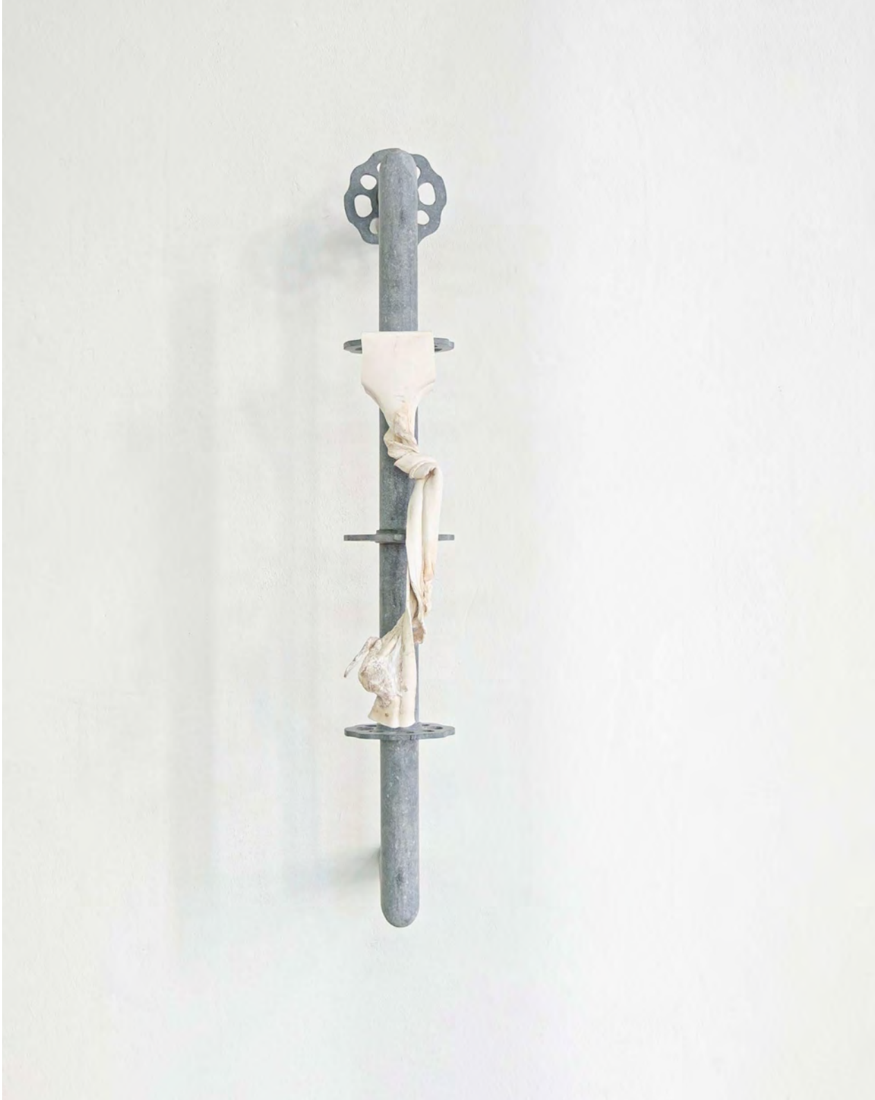
Échafauder, 2026 Pierre bleue, plastique 32x18x40 cm