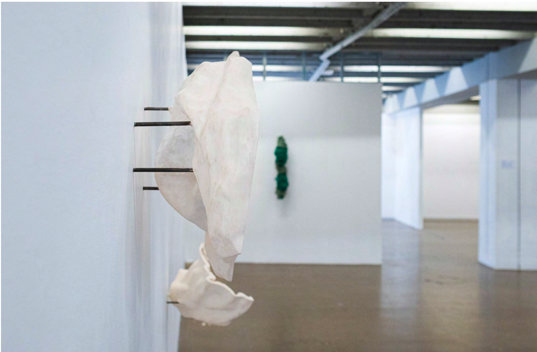
Fragments-Zone Cramée , 2025 Plâtre, acier -60x65x20 & 30x45x20