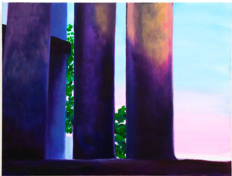
Next to the pigeon's nest , huile sur toile, 60 x 45 x 3,5 cm, 2026