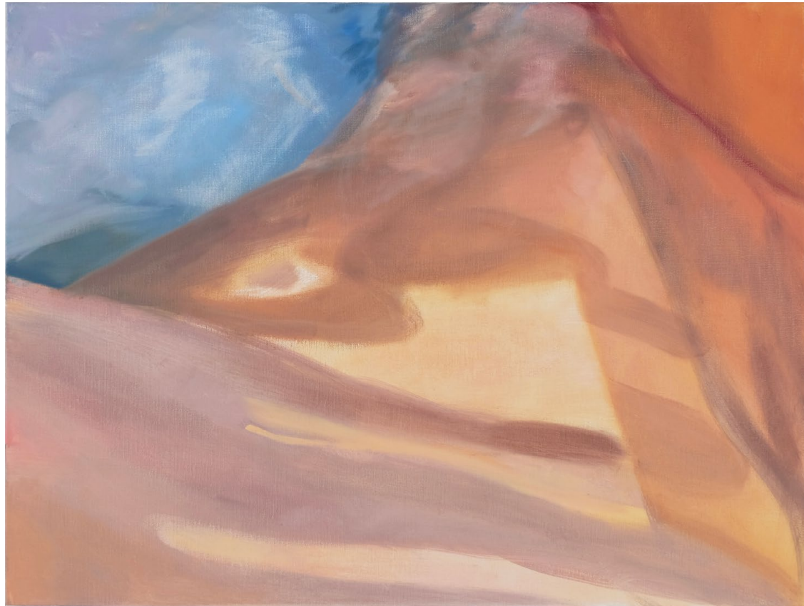
Tomorrow is another day , huile sur toile, 60 x 45 x 3,5 cm, 2025