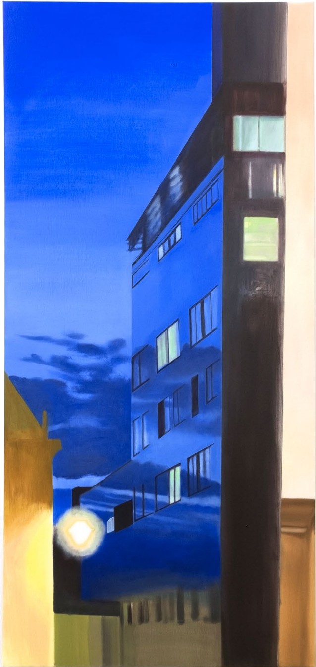
Disappearing buildings , huile sur toile, 80 x 175 x 3,5 cm, 2025