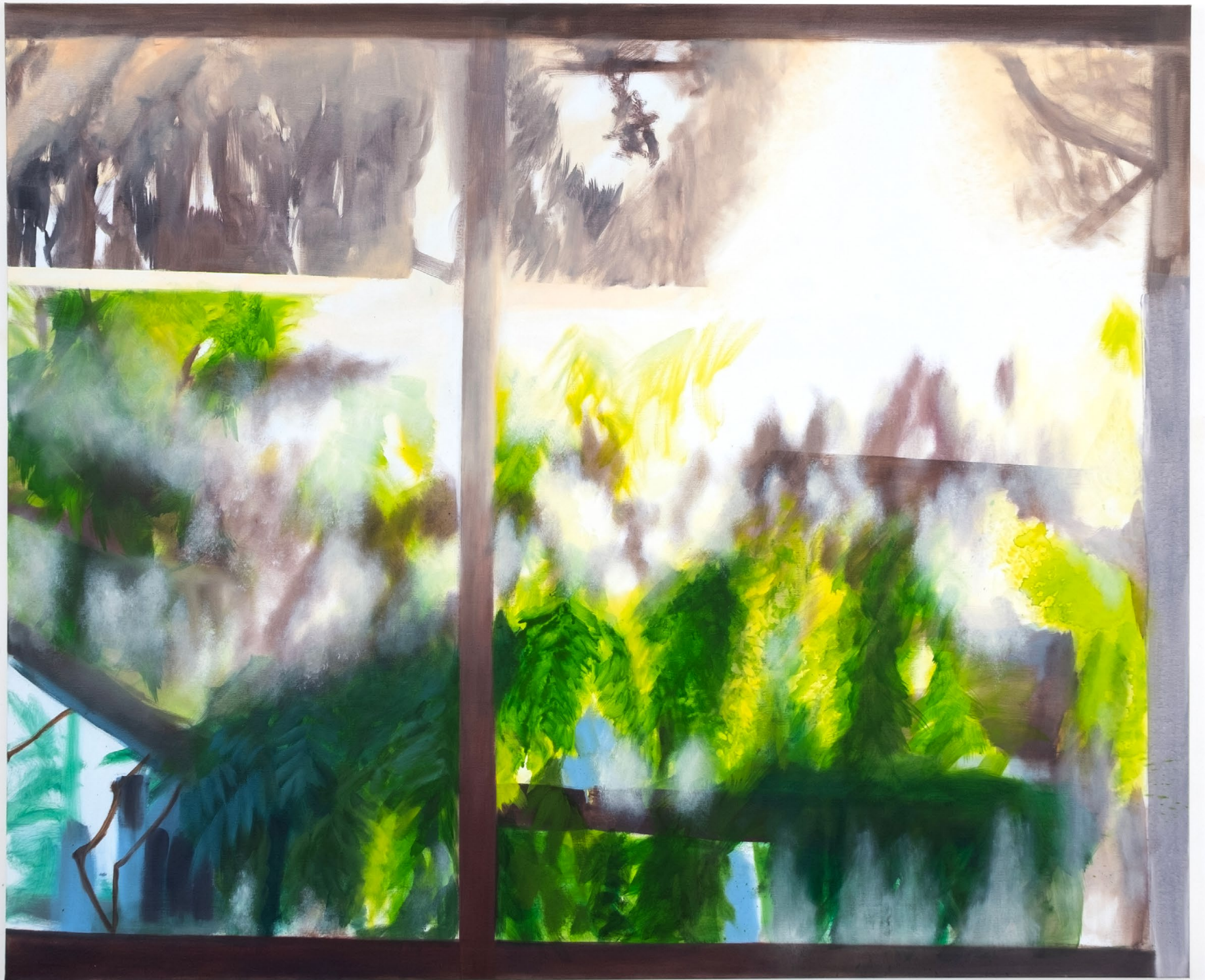
One early morning, huile sur toile, 200 x 165 x 3,5 cm, 2025