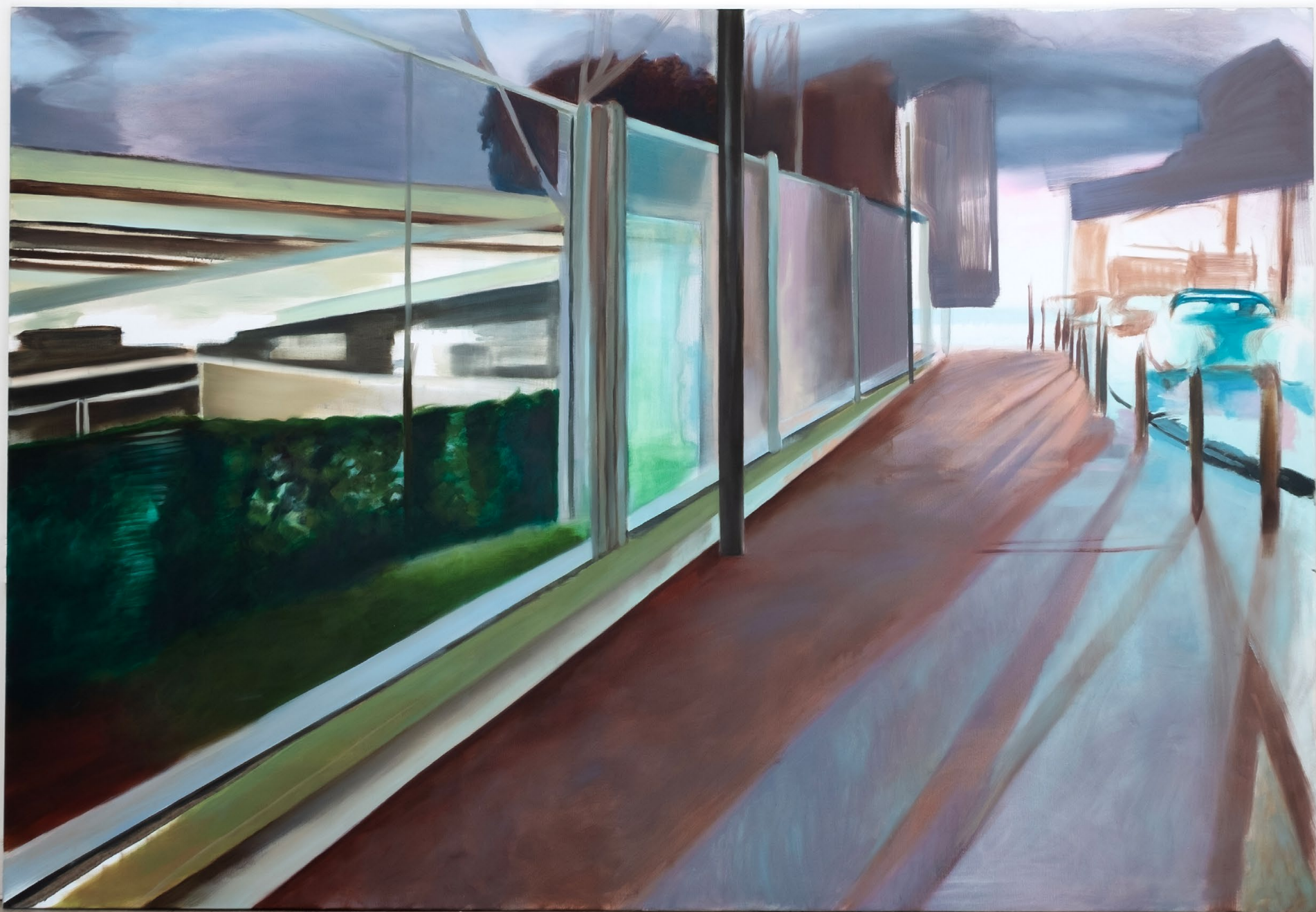
Am I arrived yet , huile sur toile, 200 x 300 x 2,5 cm, 2025