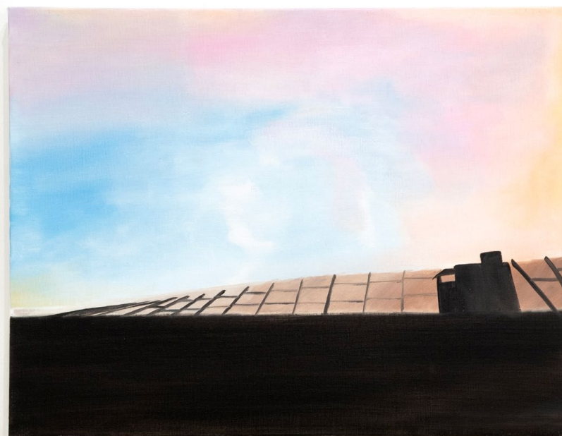
After the rain , huile sur toile, 60 x 45 x 3,5 cm, 2026