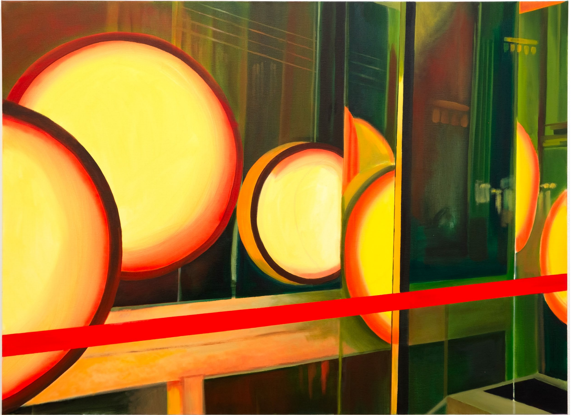
Tinnabulations , huile sur toile, 140x 100 x 3,5 cm, 2026