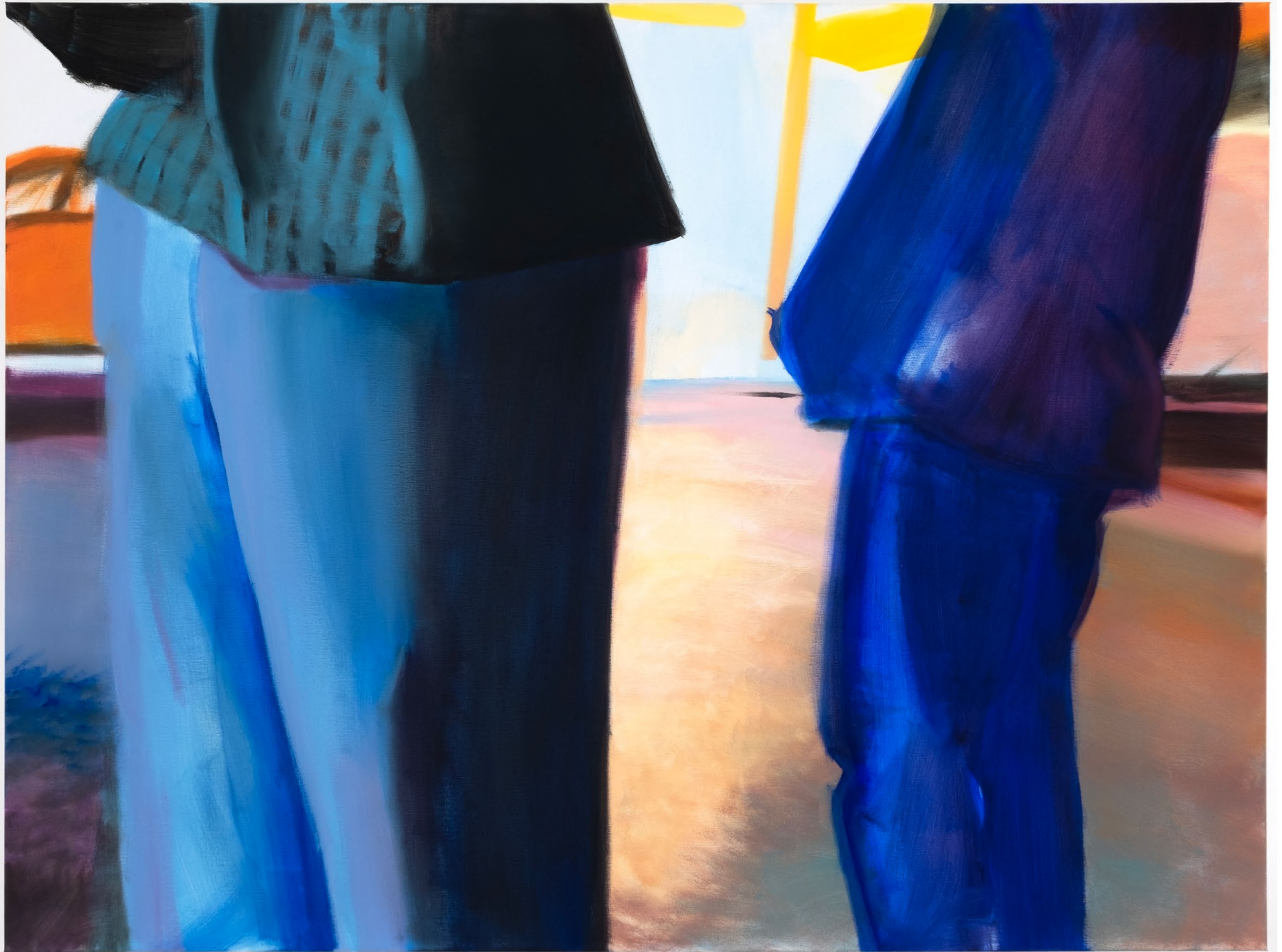
Conversation, huile sur toile, 160 x 120 x 3,5 cm, 2025